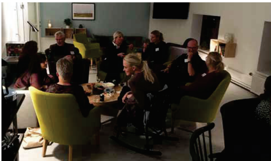
Fagprofessionelle og patientrepræsentanter netværker og arbejder videre i REHPAs dagligstue i Nyborg.