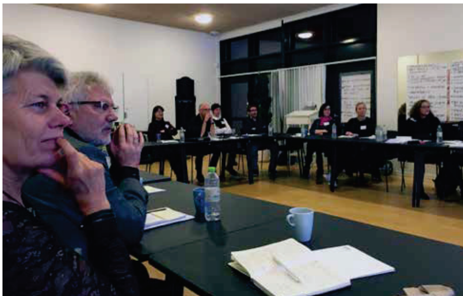
Fagprofessionelle og patientrepræsentanter lytter til faglige oplæg.

Et holdningspapir på tværs af specialer og med generelle anbefalinger, som bygger på nuværende viden, kliniske erfaringer og forståelsen af god, klinisk praksis, anses for indeværende som relevant og vigtigt i arbejdet for et fælles, klinisk afsæt og som et vigtigt første skridt frem mod egentlige kliniske retningslinjer. Det kommende holdningspapir og de understøttende aktiviteter – baseret på nuværende viden og på opsamling fra workshoppen – bør i den kommende femårs periode som minimum have fokus på nedenstående områder.