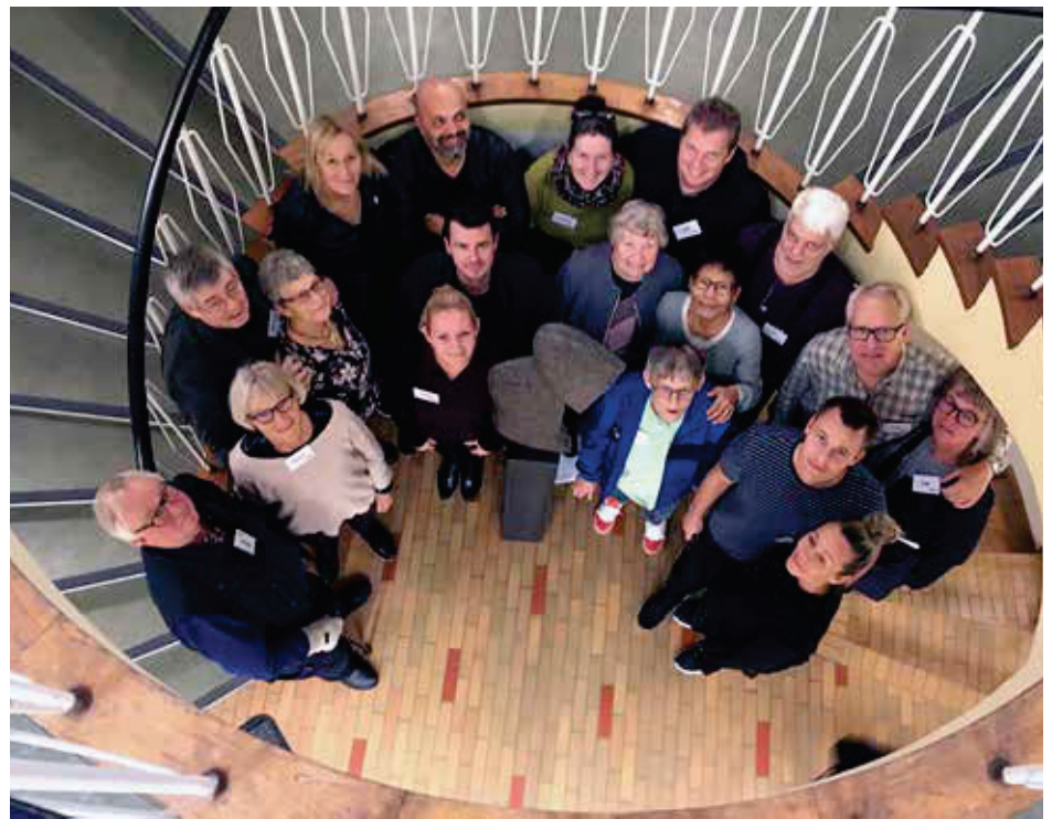
Hjertestopoverlevende og deres pårørende, som i uge 46, 2018 deltog i et rehabiliteringsophold hos REPHA

fagprofessionelle får mulighed for at indgå i dialog og stille spørgsmål direkte til informanter.